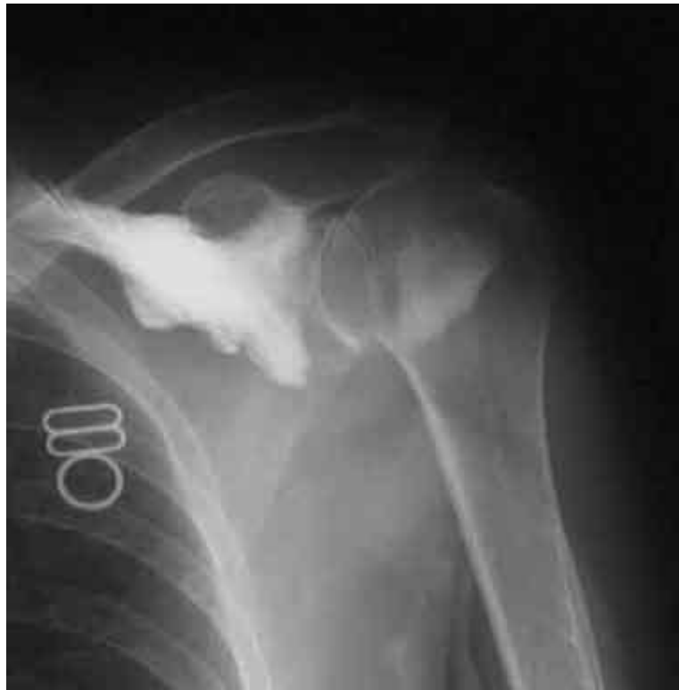
▲凍結肩の肩造影検査